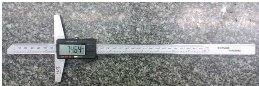
Рисунок 2 – Штангенглубиномер ШГЦ