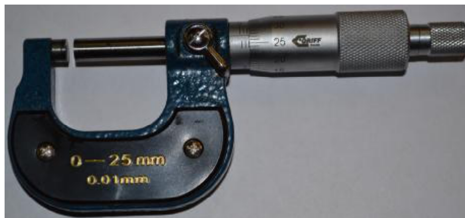
Рисунок 1 - Общий вид микрометров торговой марки «GRIFF» с отсчетом по шкалам стебля и барабана

Измерительные поверхности оснащены твердым сплавом. Для установки микрометров с нижним пределом измерений от 25 мм в начальное положение используется установочная мера. Микрометры комплектуются одной установочной мерой. Скобы микрометров оснащены термоизоляционными накладками для предотвращения влияния тепла рук.