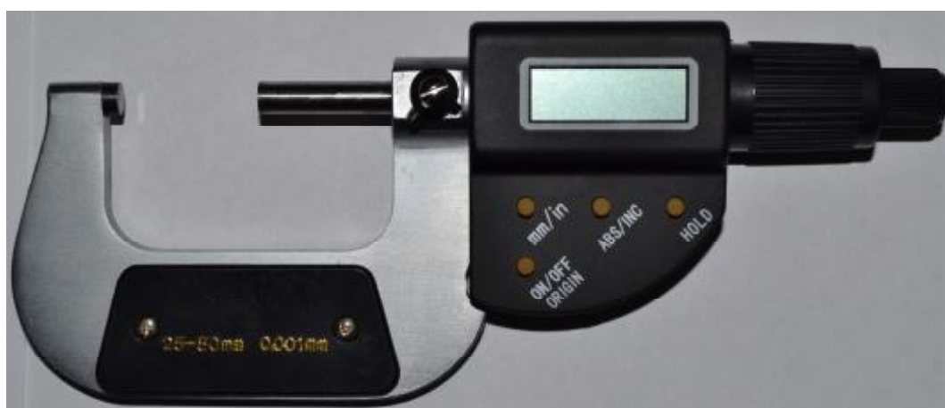
Рисунок 2 - Общий вид микрометров торговой марки «GRIFF» с цифровым отсчетным устройством