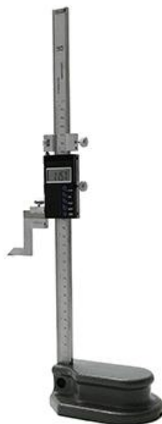
Рисунок 2 - Общий вид штангенрейсмаса ШРЦ