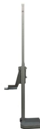
а) штангенрейсмас с разметочной ножкой б) штангенрейсмас с измерительной ножкой