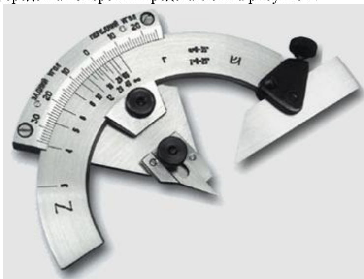
Рисунок 1 – Общий вид прибора 2УРИ

Общий вид средства измерений представлен на рисунке 1.